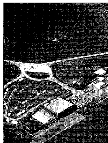
La route d'accès au CERPM a été refaite récemment.